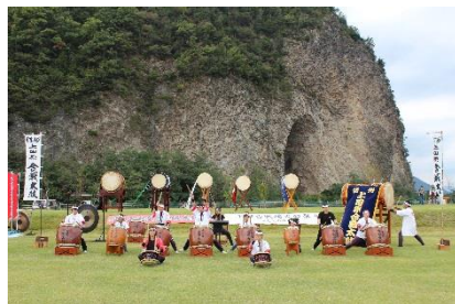
■岩鼻をバックに太鼓の演奏