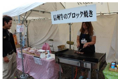
■信州牛のブロック焼き