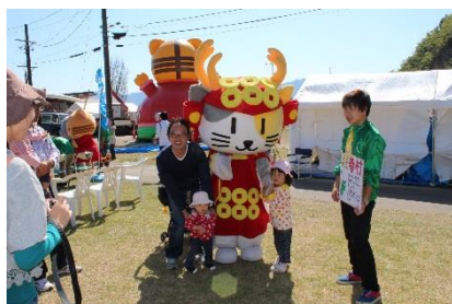
■ご当地キャラ運動会