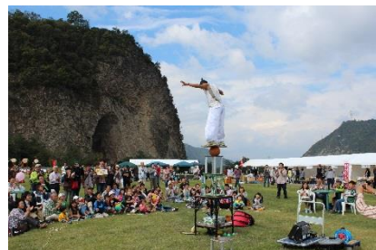
■大道芸パフォーマンス